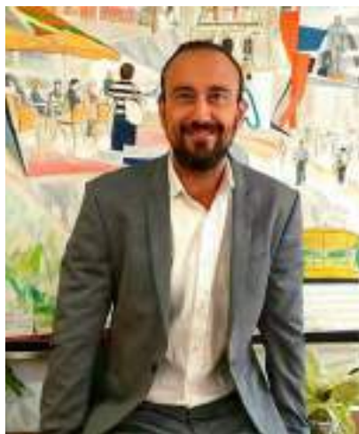
JAVIER LÓPEZ ESTRADA Alcalde de Torrelavega

También quiero aprovechar estas líneas para agradecer el trabajo de todas esas personas que están detrás de cada edición del Festival de Invierno, sin ellos, no sería posible. Y para invitaros a todos a acercaros al Teatro Municipal Concha Espina, a Torrelavega, y vivir en primera persona la 33ª edición del Festival de Invierno de Torrelavega.